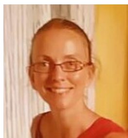
(largeur : 135)

Participation à des événements ou à des réflexions à l'international.